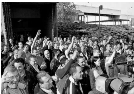
Asamblea obrera en Bélgica

Ante el terrorismo y la guerra imperialista, los trabajadores en huelga de Bélgica este lunes 23 de Noviembre dan la única respuesta : ¡ la lucha obrera, la lucha de clase !