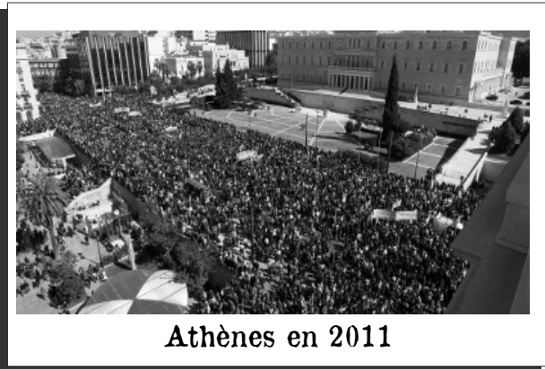
Athènes en 2011

PS. Nous invitons nos lecteurs à lire aussi la prise de position (en anglais) de la Tendance Communiste internationaliste Greece - Solidarity with the Workers not the Capitalist Government! dont nous partageons l'essentiel du positionnement et de l'orientation politiques : http://www.leftcom.org/en/articles/2015-07-10/greece-solidarity-with-the-workers-not-the-capitalist-government .