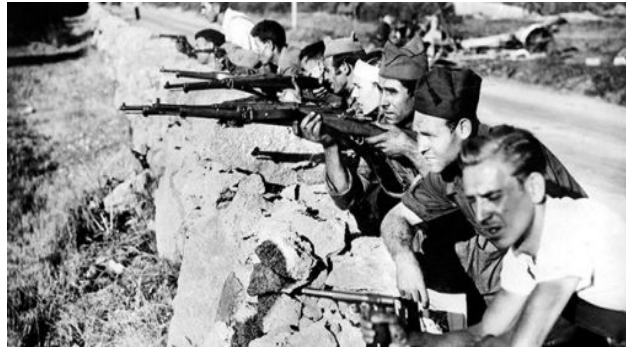
Ouvriers, devenus miliciens républicains espagnols sur le front militaire en 1936 : si loin des villes, si loin de leur intérêts de classe...

générations d'aujourd'hui, la montent (même si trop lentement à notre goût). Les premiers se dirigeaient vers la défaite sanglante car ils étaient déjà défaits politiquement et idéologiquement avant d'être massacrés sur les fronts militaires 12 . Les autres, aujourd'hui, même si la plupart ne se considèrent individuellement qu'à grand peine comme " ouvrier " et ne brandissent pas de drapeau rouge, tendent à résister aux impératifs des sacrifices derrière l'État capitaliste. Vont-ils plutôt vers une adhésion large derrière des thèmes idéologiques bourgeois (la lutte contre le terrorisme et la défense de la démocratie par exemple), vers une participation active dans des organisations politiques bourgeoises (particulièrement de gauche ou syndicale), vers un enrôlement derrière l'État et la nation, et tendent-ils à abandonner la défense de leurs intérêts de classe comme l'écrit MG ? Ou bien vont-ils plutôt vers une défense de leur intérêts immédiats de classe, vers une indifférence à l'égard des grandes campagnes idéologiques, vers une désaffection des organisations politiques et syndicales bourgeoises, un détachement et une méfiance envers l'État ? Nous pensons, que des deux tendances existantes , c'est cette dernière qui est dominante aujourd'hui et qu'elle détermine le cours des événements. Cette différence, cette direction opposée, ce cours contraire, d'avec les années 1930 est fondamentale du point de vue historique. Reconnaître cela ne veut pas dire que la victoire