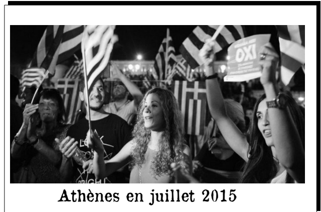
Athènes en juillet 2015

À gauche en 2011 : une manifestation massive sur la place Syntagma à Athènes, face au parlement, contre les mesures d'austérité. Il n'y a pas de drapeau grec et les manifestants tendent à s'opposer à l'État capitaliste.